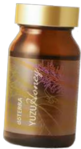
ユズハニー Yuzu Honey